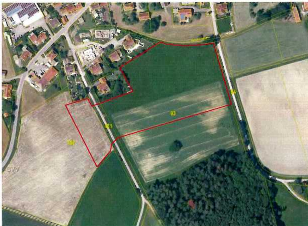
Abb. 1: Geltungsbereich des Bauvorhabens in Breitenau (Flurgrenzen: gelbe Linien; Flurnummern: gelbe Schrift).

Der Geltungsbereich nimmt jeweils Teile von drei Flurstücken in Anspruch: Flur 93 umfasst den zentralen und östlichen Teil mit 1,6 ha Fläche und besteht größtenteils aus Grünland (Nordabschnitt, Abb. 6 und Titelbild) und zu geringerem Anteil (ca. 0,6 ha) aus Acker (Südabschnitt, Abb. 2). Flur 157 im Westen beinhaltet den etwa 0,3 ha großen Ostteil einer Ackerfläche (Abb. 7). Flur 161 ist der verbindende Abschnitt der querenden Flurstraße mit begleitenden Seitengräben und Wiesensäumen (Abb. 7, 8). Im Norden grenzt der Geltungsbereich an bestehende Wohnbebauung (Abb. 6) und an einen Wiesengraben (Hahnäckergraben, Flur 74) an. Der Wiesengraben verläuft in einer Geländesenke (Abb. 5). Jenseits des Grabens setzt sich die Grünlandfläche nordwärts als Flur Nr. 83 fort. Im Nordosteck säumt den Graben ein Feldgehölz mit einer alten, gegabelten Eiche und mit Laubgebüsch (Abb. 4, 5). Der Ostrand wird von einer Flurstraße mit Seitengräben markiert (Flur 94, Abb. 3). Im Westen und Südwesten schließen Ackerflächen an. Im Süden setzt sich der Acker der Flur 93 am leicht ansteigenden Hang noch ca. 65 m bis zu einem Wiesenstreifen und dem Rand eines gut strukturierten Mischwaldes an. Etwa 40 m südlich (oberhalb) des Südrandes des Geltungsbereiches steht ein alter, das Landschaftsbild prägender Nussbaum in der Ackerfläche (Abb. 2 und kleines Foto auf Titelseite).