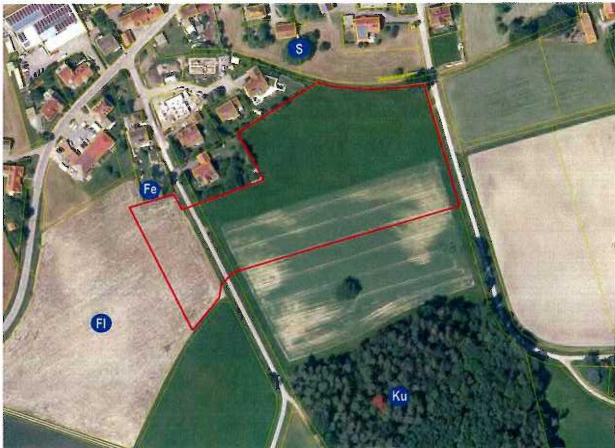
Abb. 11: Brutviere artenschutzrechtlich relevanter Vogelarten im Untersuchungsraum 2020. Fe: Feldsperling, Fl: Feldlerche, Ku: Kuckuck (außerhalb Wirkraum), S: Star.

Im Wald südlich des Geltungsbereiches wurde auch der Kuckuck festgestellt (Ku in Abb. 11). Diese prinzipiell relevante Art ist ebenfalls nicht von dem Vorhaben betroffen, da der Kuckuck als Brutparasit nur Vogelnester in Gehölzbeständen zur Eiablage nutzt. Die Gehölzinsel im Nordosten ist zu klein und exponiert, um als Brutplatz infrage zu kommen. Der Wald im Süden - als geeignetes Bruthabitat - liegt außerhalb des Wirkraumes der Planung.