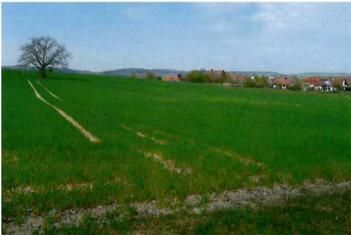
Abb. 2: Blick von Osten westwärts über die Ackerfläche der Flur 93 mit dem solitären Nussbaum im oberen Abschnitt. Der Geltungsbereich der geplanten Bebauung beginnt etwa 40 m nördlich (im Bild rechts) des Baumes. Aufnahmedatum: 17.04.2020.