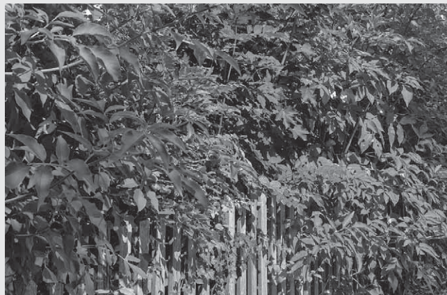
Private Hecken und Sträucher sowie Bäume, die auf Fahrbahnen und Gehwegen hineinragen, müssen von den Grundstückseigentümern aus Gründen der Verkehrssicherheit regelmäßig geschnitten werden.

Das Säubern der Straßen und Gehwege umfasst gemäß der städtischen Verordnung die Beseitigung von Kehricht, Schlamm, Laub, Unkraut und sonstigen Unrat. Dazu