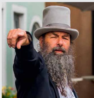
Johann Georg von Soldner „live“ in Feuchtwangen am 12. Juli 2025 um 14 Uhr.

Der aus Feuchtwangen stammende Johann Georg von Soldner leistete einen wichtigen Beitrag zur Landesvermessung Bayerns. Auf ihn geht unter anderem das Soldner-Koordinatensystem zurück, das in weiten Teilen Deutschlands noch bis ins 20. Jahrhundert benutzt wurde.