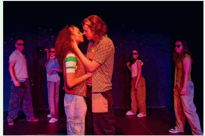
Schauspielstudierende der Freien Schauspielschule Hamburg sind mit dem Theaterprojekt „Julia und Romeo“ ab 10. Juli im Nixel-Garten zu sehen.

Es geht um Liebe. Es geht um Hass. Es geht um die Unmöglichkeit, man selbst zu sein in einer zerrissenen Gesellschaft. Das berühmte Drama Shakespeares „Romeo und Julia“ ist eine grandiose Vorlage für eine zeitgenössische Interpretation. Die Aufführung bei den Kreuzgangspielen schildert das Geschehen, wie Julia es erlebt; ihr Blick auf die Welt ist der einer jungen Frau von heute. Sie kämpft gegen die ungerechten Gegebenheiten, gegen die fatalen Zumutungen und verachtenden Haltungen einer Gesellschaft, in der sie leben muss. Sie erkämpft sich ihren Raum, ihre Welt, in der Hoffnung, dass dort alles so werden kann, wie sie es sich wünscht und für richtig hält. Ihr Blick ist scharf, ihr Herz ist groß. Ihr Schicksal berührt und stellt uns viele Fragen.