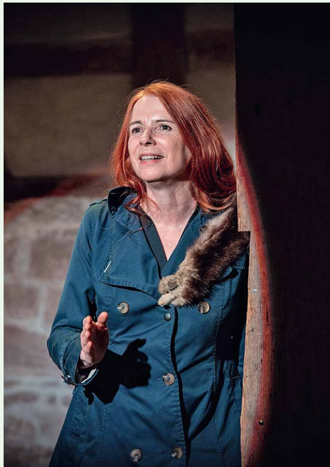
„Rahel“ – eine berührende Aufführung in der stimmungsvollen Nixel-Scheune.