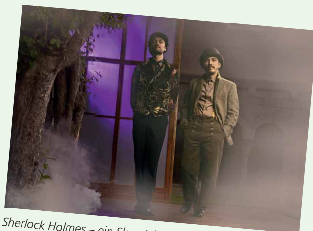
Sherlock Holmes – ein Skandal