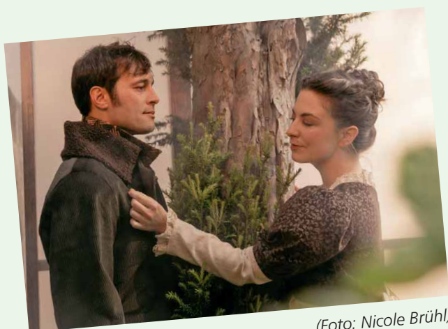
Stolz und Vorurteil