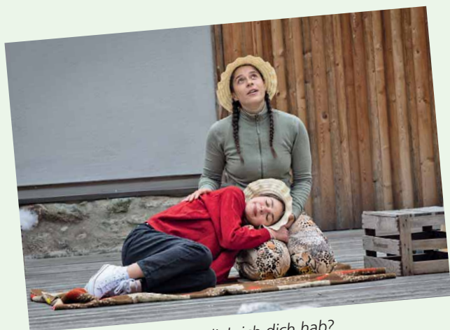
Weißt du eigentlich, wie lieb ich dich hab?