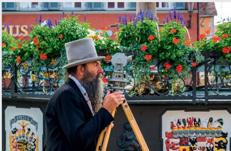
Am Pfingstsonntag, 8. Juni 2025 gibt es Johann Georg von Soldner wieder live zu erleben.

Am Pfingstsonntag, 8. Juni 2025 kann man wieder das Feuchtwanger Ausnahmetalent, den Geodäten Johann Georg von Soldner , näher kennenlernen. Der aus Feuchtwangen stammende Johann Georg von Soldner leistete einen wichtigen Beitrag zur Landesvermessung Bayerns. Auf ihn geht unter anderem das Soldner-Koordinatensystem zurück, das in weiten Teilen Deutschlands noch bis ins 20. Jahrhundert benutzt wurde.