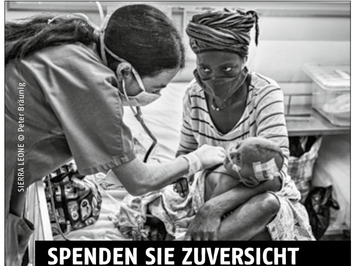
SIERRA LEONE

Staatlich anerkannte Beratungsstelle für Schwangerschaftsfragen beim Landratsamt Ansbach – Gesundheitsamt, Crailsheimstraße 64, 91522 Ansbach, www.schwanger-in-ansbach.de