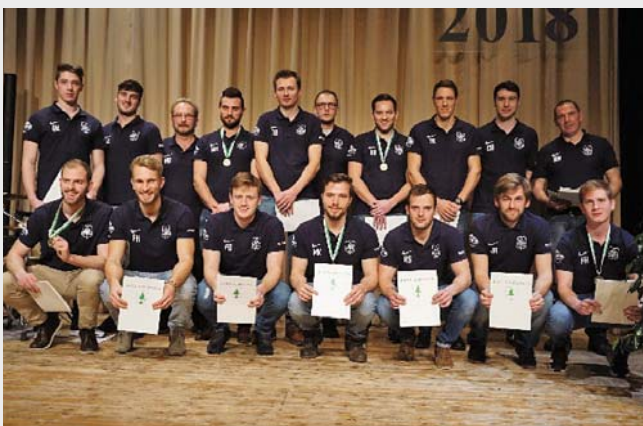
Die 1. Herrenmannschaft des TuS Feuchtwangen – Abteilung Fußball erhielt für den Aufstieg in die Landesliga Nordwest die Medaille in Bronze.