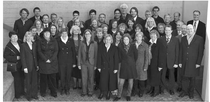
Kirchenchor St. Christophorus, Ingolstadt

Das Konzert wird in gleicher Besetzung am Sonntag, den 23. Oktober um 17.00 Uhr in der St. Moritzkirche im Zentrum von Ingolstadt wiederholt.