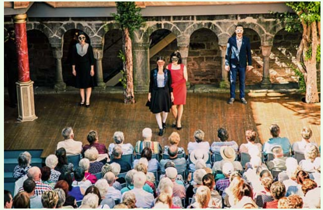
Vom 14. Mai bis zum 13. August 2017 wird im romanischen Kreuzgang und darüber hinaus wieder Theater gespielt. Hier ist eine Szene aus „Romeo und Julia“ 2016 zu sehen.

Karten zur neuen Spielzeit gibt es ab 20. Oktober 2016 im Kulturbüro der Stadt Feuchtwangen, Marktplatz 2, 91555 Feuchtwangen, Telefon: 09852/904 44, E-Mail: mail@kreuzgangspiele.de, auf www.kreuzgangspiele.de und auf www.reservix.de