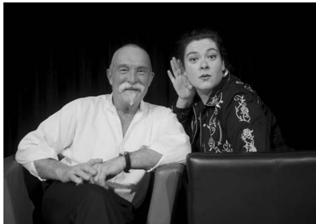
Nora Gomringer ©

Alle Informationen sowie Karten für die einzelnen wortarten-Veranstaltungen gibt es im Kulturbüro der Stadt Feuchtwangen, Marktplatz 2, 91555 Feuchtwangen, kulturamt@feuchtwangen.de Kartentelefon: 09852/904 44