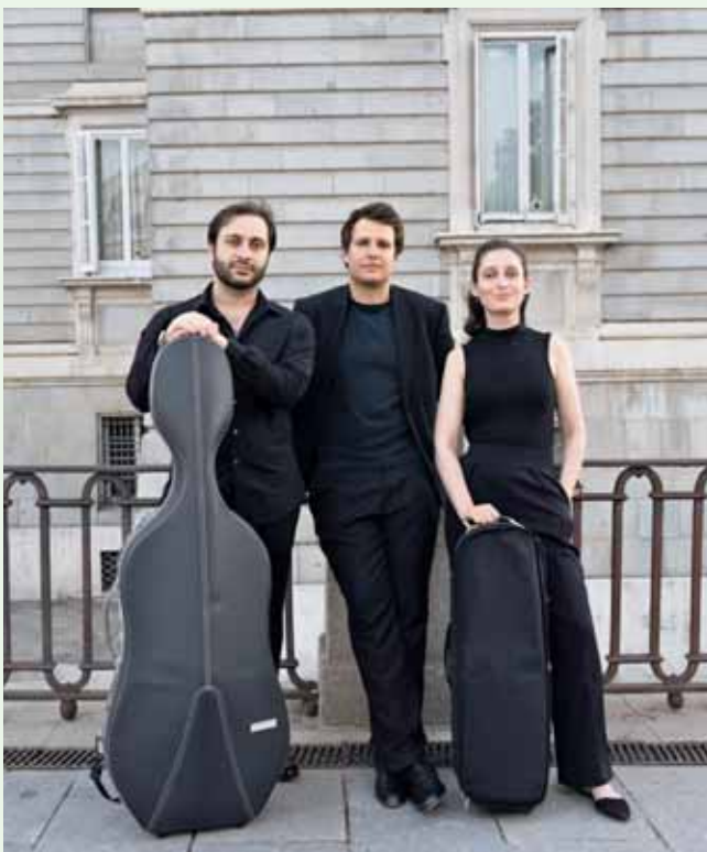
Das hochgelobte Trio E. T. A. gastiert am 7. April 2024 in Feuchtwangen.