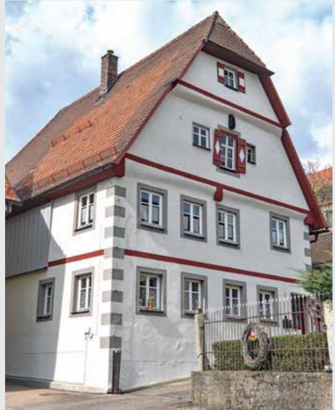
Das historische Einzeldenkmal am Vorderen Spitzenberg 7 in Feuchtwangen strahlt nach besonders gelungener Sanierung wieder in neuem Glanz.

In enger Abstimmung mit dem Landesamt für Denkmalpflege legte Härtfelder bei der Instandsetzung besonde-