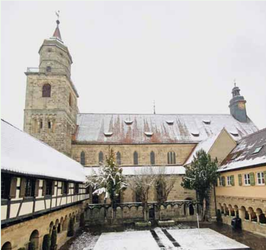
Winterzauber im Kreuzgang: Der sommerliche Theaterort erscheint derzeit weiß verkleidet.

Großes Interesse: Schon 12.000 Karten verkauft