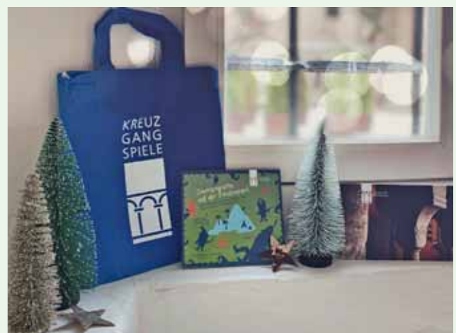
Schönes Schenken mit den Kreuzgangspielen: Beim Kauf eines Festspiel-Gutscheins der Kreuzgangspiele gibt es bis 22. Dezember eine Baumwolltasche mit Logo dazu.

Informationen zu den nächsten Vorstellungen, dem Sommer-Spielplan 2024 sind immer im Internet zu finden: www.kreuzgangspiele.de .