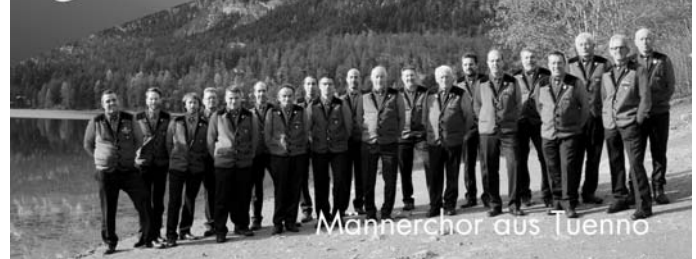
Männerchor aus Tuenno