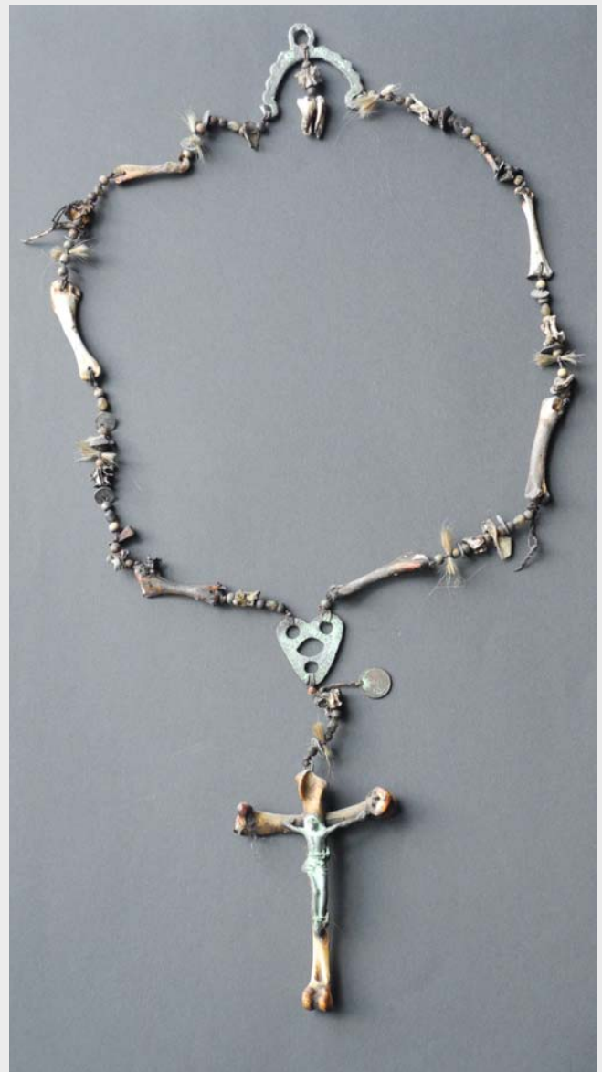
„Stallbetten“. Rosenkranz aus Hühnerknochen mit Amuletten und magischen Anhängseln, 19. Jh.

Magische Hilfe versprach auch ein Amulettbüchlein mit Teufelsfinger, Bein und Totenschädel (Holz, geschnitzt), der mit einem Eisennagel gepfählt ist.