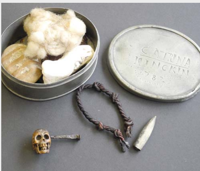
Amulettdose. Zinn, 1782, mit „Teufelsfinger“ (Belemnit), kleinem Totenschädel, geknoteter Lederschnur und anderen magischen Abwehrmitteln.

Viele Amulette sind mit dem Pentagramm („Drudenfuß“, fünfzackiger Stern), einem Zauberspruch oder einer Formel aus der Kabbala bezeichnet.