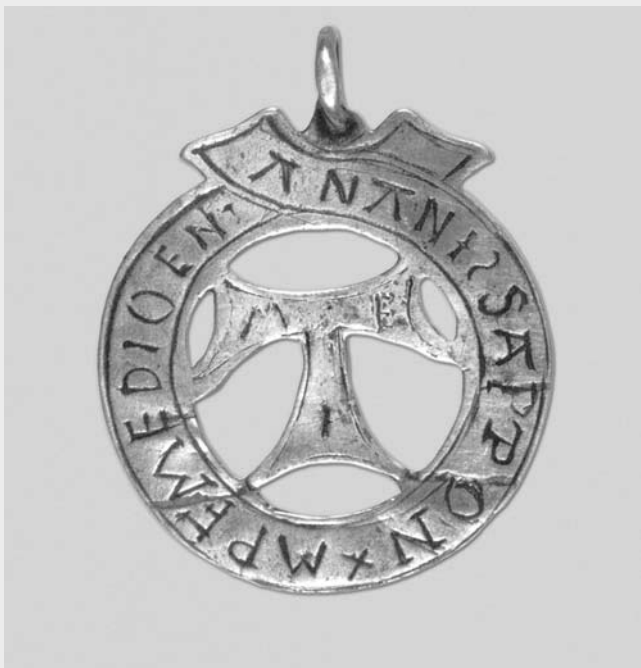
Taukreuz. Silber, graviert 17. Jh., Taukreuze haben die Form eines T, sie wurden als Sinnbild der Dreifaltigkeit verstanden. Im Volksglauben waren sie wirkungsmächtige Amulette gegen Fieber, Pest und Krankheiten.

Gegen Ärzte gab es große Vorbehalte. Im Krankheitsfall griff man lieber zu bewährten Hausmitteln. Trat keine