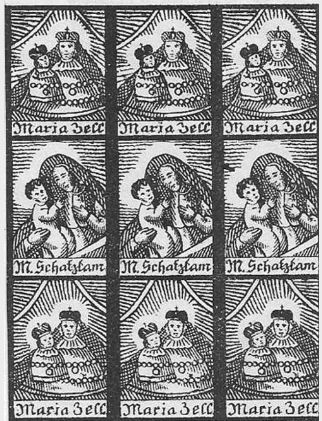
Schluckbildchen. Von Wallfahrtsorten brachte man im 19. Jh. Papierbögen mit, die mit dem jeweiligen Gnadenbild bedruckt waren. Sie wurden in einzelne Bildchen geschnitten, in Wasser eingeweicht und zu einer Art Pille gedreht, die der Kranke in der Hoffnung auf Heilung verschluckte.

Rationale und irrationale Weltsicht, empirisches Wissen und mythisches Glauben sind in der Volksmedizin eng verflochten. Die Bedeutung der Speisen, aber auch von