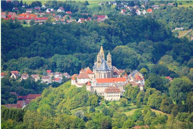
Blick vom Einkorn auf die Comburg.

Am 25. November findet eine Fahrt nach Schwäbisch Hall statt