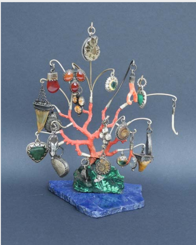
Korallenbäumchen mit zahlreichen Amuletten, darunter Haifischzahn, Ammonit, Bergkristall, rote Koralle, Penisknochen eines Marders, Augensteine, Schrecksteine, Malachit.

Mit über 300 Exponaten zeigt die Ausstellung Objekte, die die magischen Praktiken in Franken, Schwaben und Altbayern dokumentieren. Sie erzählen zugleich von den Nöten und Bedrohungen der bäuerlichen Bevölkerung im 18. und 19. Jahrhundert, die mit übernatürlichen Einflüssen erklärt wurden und die man mit zauberischen Mitteln abzuwehren suchte.