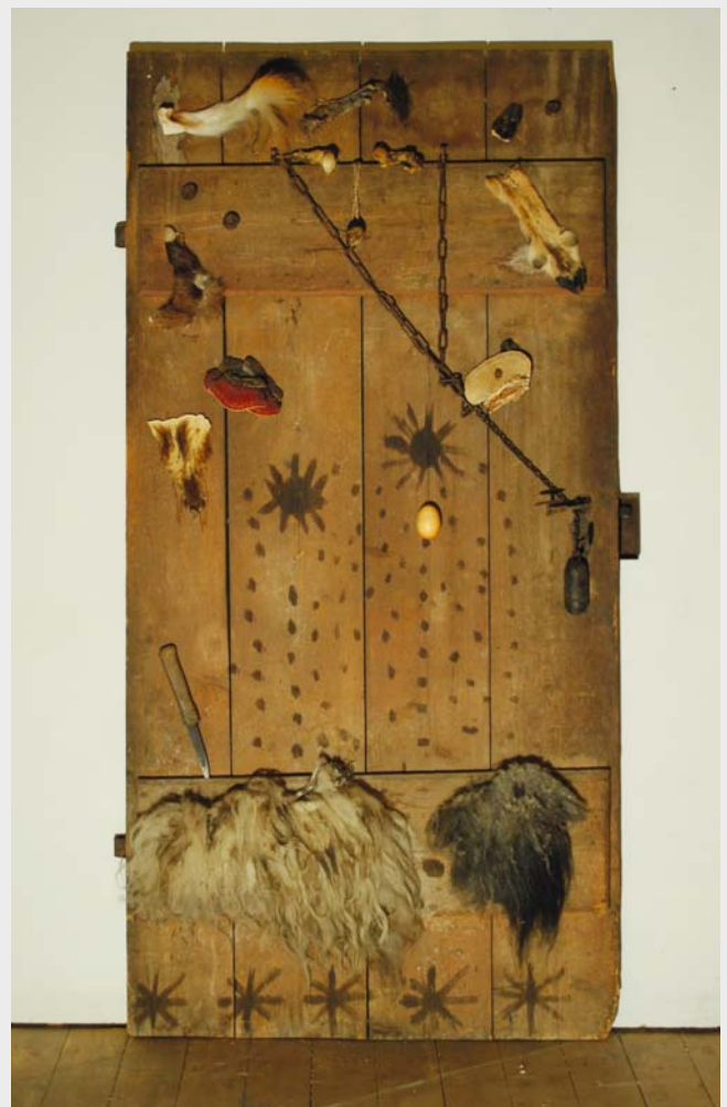
Stalltür mit magischen Zeichen und zahlreichen Abwehrmitteln.

Die Vorstellung, dass Unglück in Haus und Hof auf den schädigenden Einfluss von „bösen Leuten“ und Hexen zurückzuführen sei, war noch im 20. Jahrhundert verbreitet. Bis in die 1960er Jahre waren Hexenbanner un-