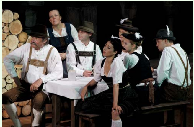
Die Kreuzgangspiele brauchen immer wieder Statistinnen und Statisten, die das Ensemble unterstützen. 2015 beispielsweise beim „Brandner Kaspar“.

Informationen zur Statisterie und zum Casting gibt es beim Künstlerischen Betriebsbüro, Daniel Asofiei, Telefon: 0171-9288677