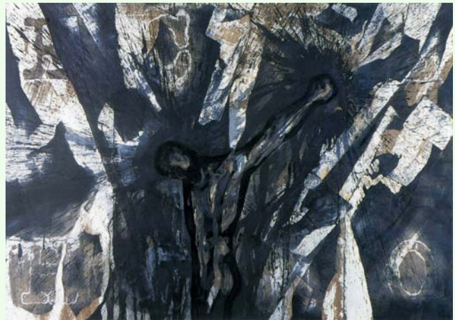
Michael Morgner, Kreuzigung

Sprachspaß mit den Reformatoren Samstag, 20. Mai 2017, 19.00 Uhr