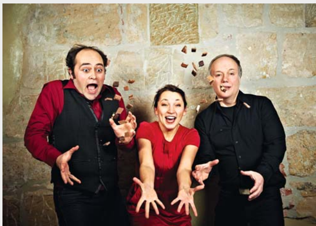
Am 11. März steht der Abend mit dem Ensemble Musenwunder ganz im Zeichen der Schokolade – zu kosten gibt es natürlich auch etwas.