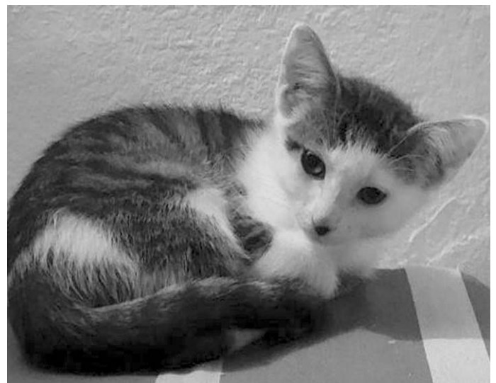
Lissi sucht ein Zuhause

Wir haben aktuell mehrere Katzen in unserer Obhut, für die wir ein neues Zuhause suchen (siehe auch unter www.tierschutzverein-feuchtwangen.de ).