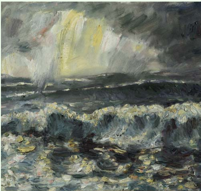
Sepp Veas_Bretagne – Finistere

„Das Wasser rauscht‘, das Wasser schwoll ... und schwarz und stürmisch war die Nacht.“