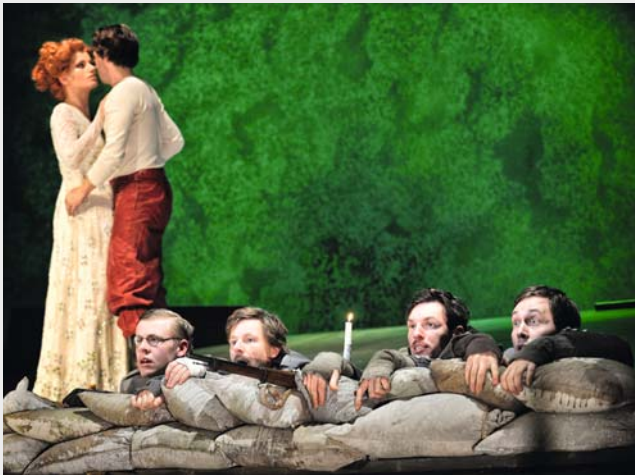
„Weihnachten an der Front“ – eine musikalische Revue mit Leichtigkeit und Ernst bringt die WLB am 19.12. auf die Bühne.