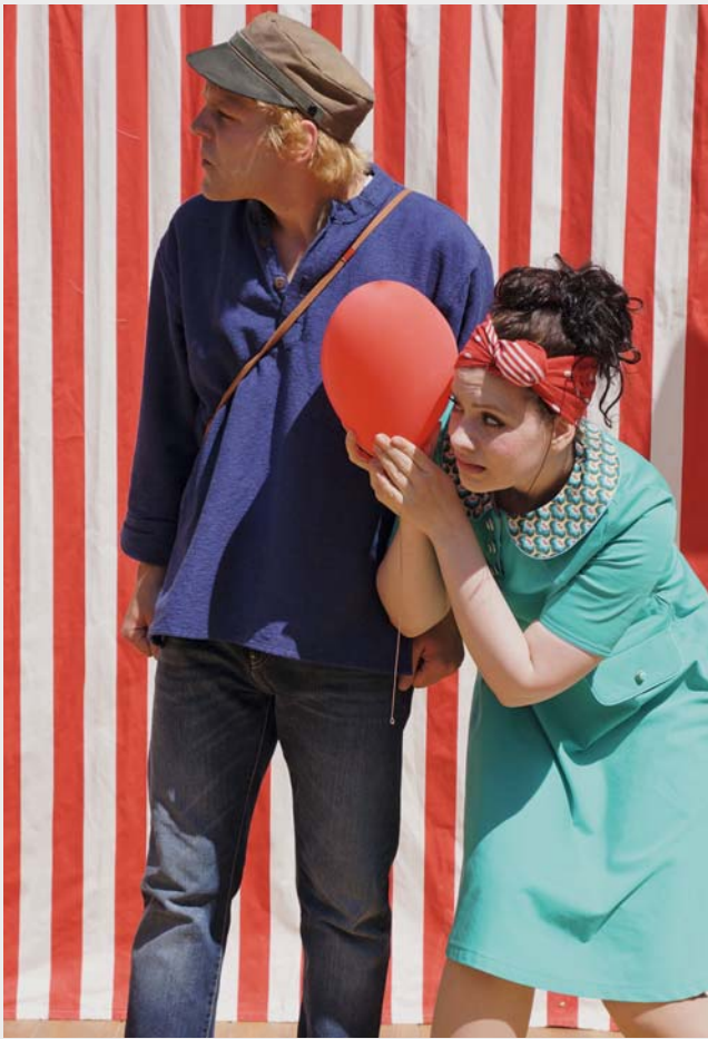
Noch bis zum 15. August heckt Michel jeden Nachmittag ab 16.15 Uhr seine Streiche aus.