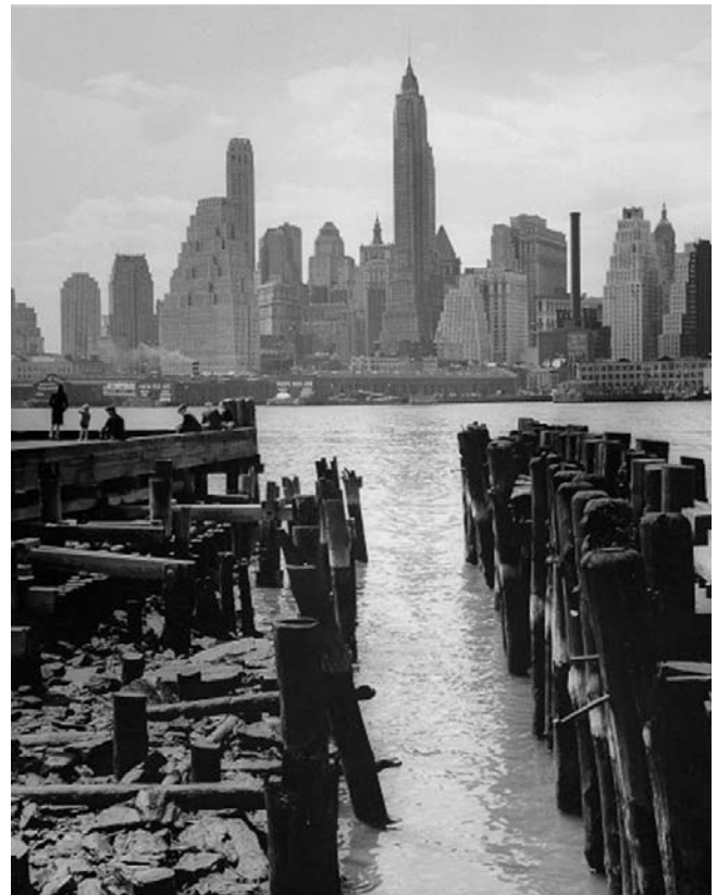
Lower East Side von Brooklyn aus gesehen, New York 1940

Ganz entspannt durch die Ausstellung spazieren, Zeit haben, sich jedes Bild genau zu betrachten, einen dampfenden Kaffee und ein Stück Kuchen... Kunst mit Schlag, dazu den ganzen Nachmittag Führungen durch die Ausstellung, das gibt es am 28. Juni in der Sonderausstellung „Andreas Feininger, New York in the Forties. Fotografien“ im Fränkischen Museum Feuchtwangen. Kommen Sie vorbei und genießen Sie Ihren Sonntagnachmittag bei Kaffee und Kuchen doch mal garniert mit den wunderbaren Fotografien Andreas Feingers.