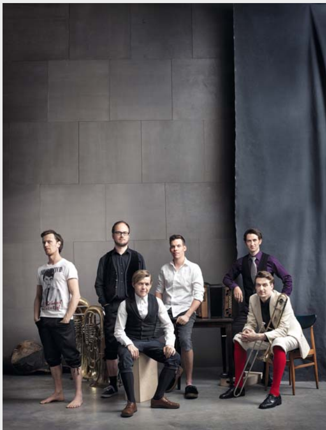
Am 29. Juni gibt der Holstunarmusigbigbandclub – kurz HMBC – erneut im Kreuzgang ein Konzert.