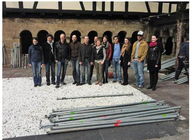
Am 13. April haben die Proben für Astrid Lindgrens „Michel in der Suppenschüssel“ begonnen.