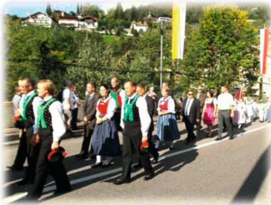
... die Stadträte sind auch dabei