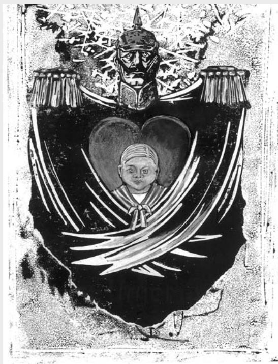
Heinrich Mann: Der Untertan