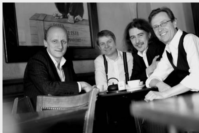
Das Quartett „Hot Club d’Allemagne“ ist am 10. Oktober in der Spielbank zu erleben.