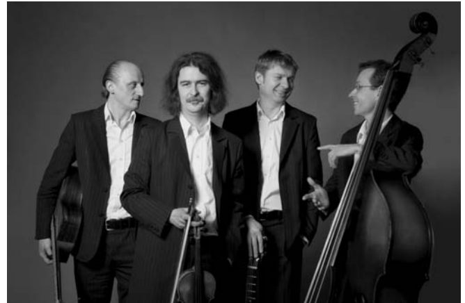
Das Quartett „Hot Club d’Allemagne“ entführt Sie am 10. Oktober in die Zeit des Swing im Paris der 30er und 40er Jahre.

Karten und weitere Informationen sind im Kulturbüro der Stadt Feuchtwangen, Marktplatz 2, 91555 Feuchtwangen, Telefon: 09852/90444, E-Mail: kulturamt@feuchtwangen.de sowie an der Abendkasse erhältlich.