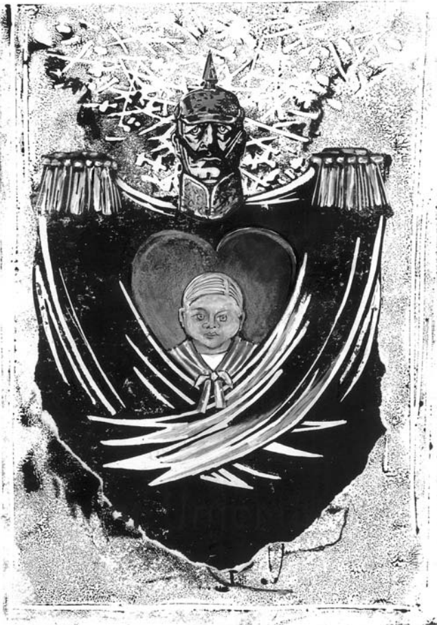
Die Gastspiele der Württembergischen Landesbühne im Herbst/ Winter 2014/15 starten mit einer Romanadaption nach Heinrich Manns „Der Untertan“.

In der Kulturtreff-Saison 2014/15 werden die folgenden Inszenierungen auf der Kasten-Bühne zu sehen sein: