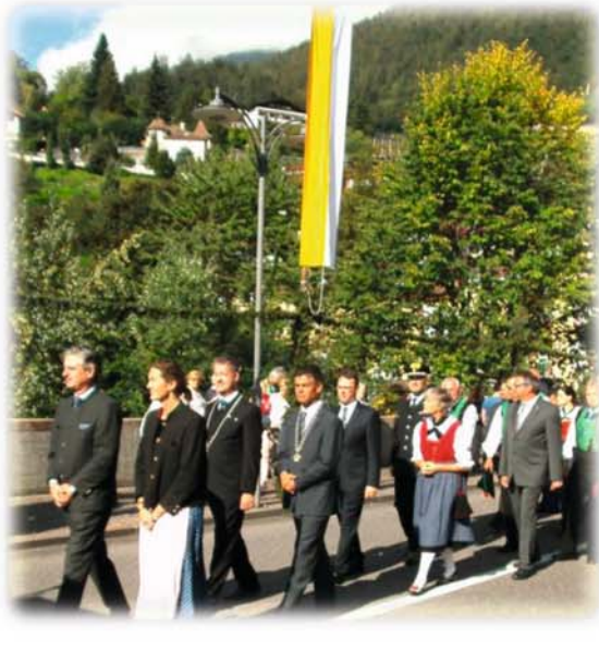
Teilnahme der Bürgermeister