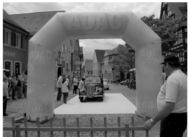
Das Foto zeigt den gelben Torbogen des ADAC-Ortsclub Feuchtwangen, durch den die Teilnehmer der Württemberg Historic am Samstag fahren müssen.

Am Samstag, 4. Mai, werden im Rahmen der 15. ADAC Württemberg Historic rund 120 schicke Oldtimer in Feuchtwangen erwartet. Der erste Rallye-Teilnehmer wird in der Kreuzgangstadt gegen 12.30 Uhr eintreffen. Im Minutentakt rollen dann weitere historische Automobile an den Zuschauern vorbei. Der Bereich Marktplatz/Untere Torstraße soll dann für zwei Stunden zur großen Partymeile werden. Die Oldtimer werden beim Durchfahren einer Kontrollstation über einen gelben Teppich und einem gelben Torbogen rollen und dabei vom ADAC-Ortsclub Feuchtwangen begrüßt. Alle Fahrzeuge werden dort vorgestellt und deren Teilnehmer erhalten vom Tourist-Büro Informationspakete sowie leckere Pralinen. Der Oldtimerstammtisch Feuchtwangen wird darüber hinaus eine Fahrzeugparade am Marktplatz präsentieren. Auch hat Bürgermeister Patrick Ruh seine Teilnahme beim großen Stelldichein zugesagt. Da zahlreiche Schaulustige erwartet werden, ist die Untere Torstraße zwischen dem Marktplatz und dem Zwinger zwischen 12 Uhr und 15 Uhr vollständig gesperrt. Ebenso wird in dieser Zeitspanne die Spitalstraße ab Einmündung in die Staatsstraße 2222 sowie die Hindenburgstraße ab dem Oberen Tor für den Durchgangsverkehr gesperrt.