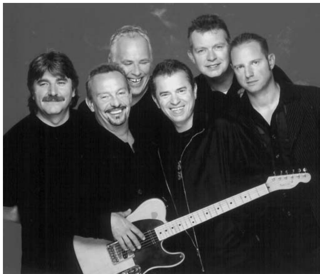
Spider Murphy Gang

6.11.2013 Württembergische Landesbühne 20 Uhr Friedrich Dürrenmatt: Die Physiker Kasten ein paradoxes, gefährliches Versteckspiel im Irrenhaus 19.15 Uhr Einführung in der Schranne