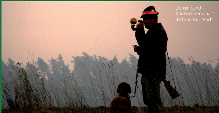
„Unser Land - fränkisch regional“ Bild von Kurt Pachl

Bildbände, Rezepte und Fach- bücher rund um Fisch & Wild Eine bunte Präsentation, arrangiert vom Buchhaus Sommer.