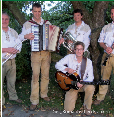
Die „Romantischen Franken“